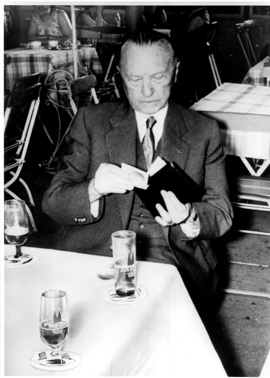
Herr Ober, zahlen! Konrad Adenauer in der Wirtschaft mit Dom-Kölsch und Dom-Pils.